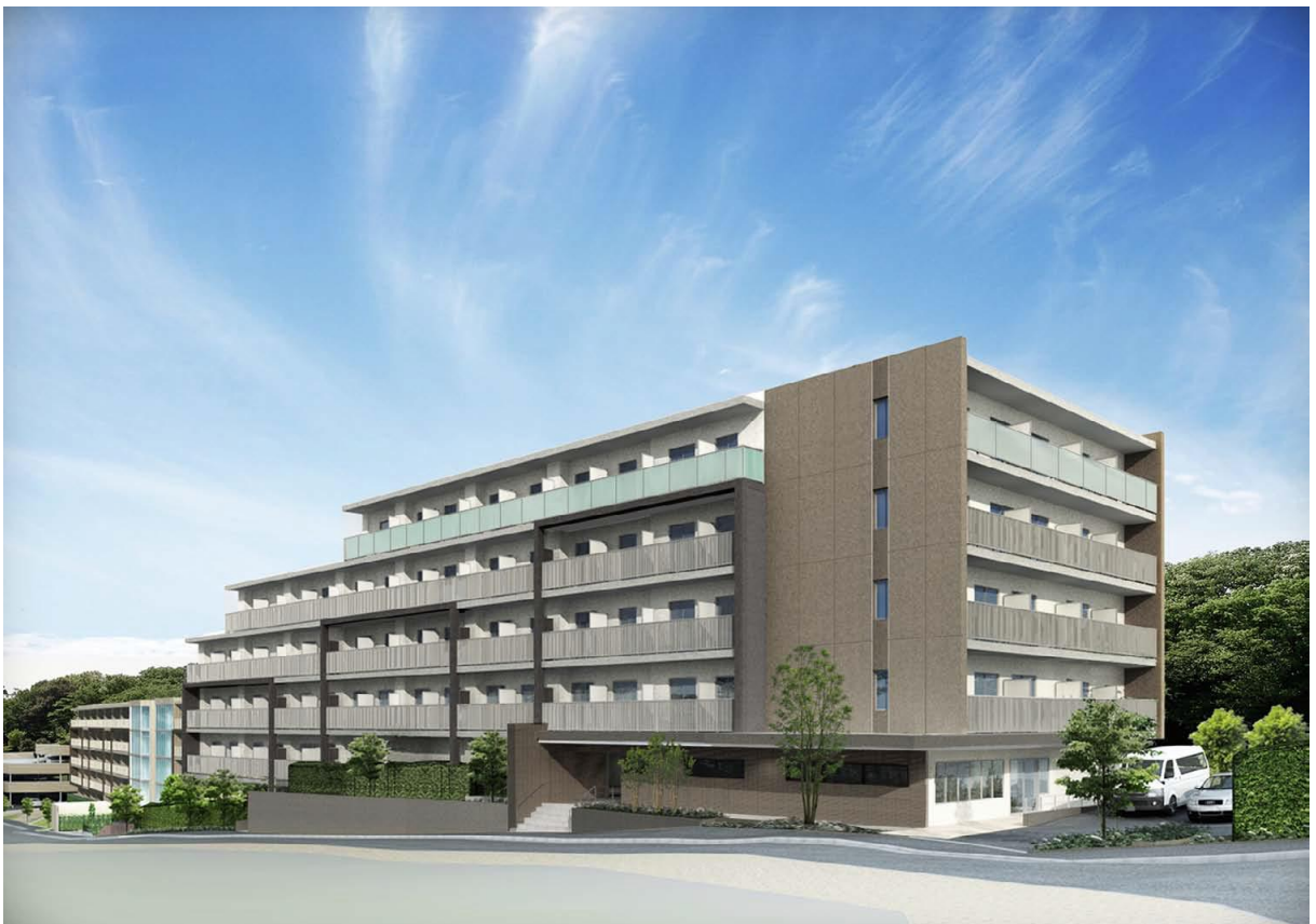
※GFE 計画外観完成予想 CG